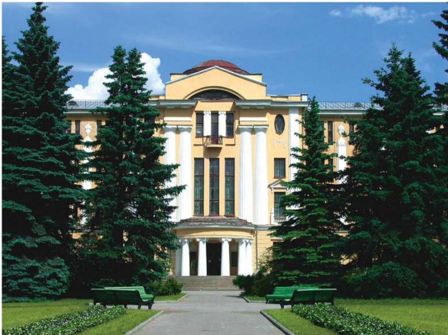
Ботанический институт им. В. Л. Комарова Российской академии наук